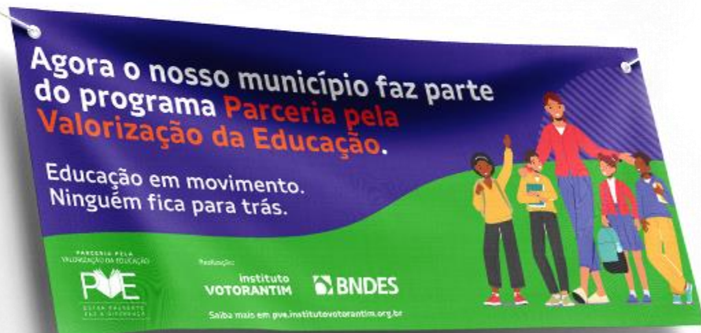
Faixa de Boas-vindas