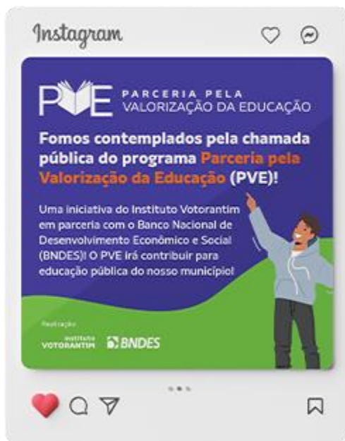
Card para redes sociais