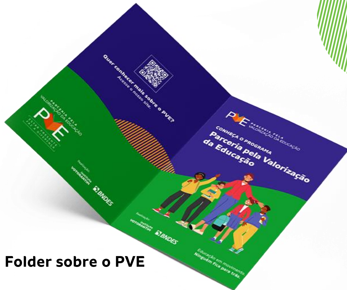
Folder sobre o PVE